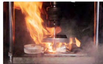
つぶされたバッテリーの発火事故の再現

リチウムイオンバッテリーは外部からの衝撃が加わり、へこむなどすると内部ショートが生じ、発煙や発火につながります。リチウムイオンバッテリーを搭載した製品は小型のものも多く、手をすべらせて落下させたり、ポケットに入れたまま座って体の下敷きにしたりなどして事故となることがあります。外部からの衝撃が加わることのないよう注意しましょう。