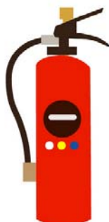
(業務用：ABC粉末消火器)